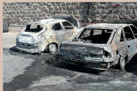
“ Comme dans le 93 ”

brûlé rue de la République, comme dans le 93 ! Depuis des années les habitants du quartier disent que le parking au même endroit est une zone de non droit, avec concerts bruyants, trafic de drogues et bagarres en tous genres, mais la police municipale n'a jamais rien fait... Dernier épisode, le 3 septembre, une attaque à main armée, par deux individus cagoulés, contre le bureau de tabac en bas de la promenade. Encore plus fort, lorsqu'il s'est agi de visionner le film pris par la caméra municipale la plus proche, il se serait avéré flou, à cause de saleté de l'objectif de la caméra ! A l'évidence, la passivité de la police municipale au centre-ville, qui ne peut procéder que de consignes, est perçue comme un feu vert par les voyous !