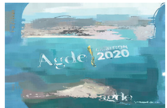
« songe creux municipal »