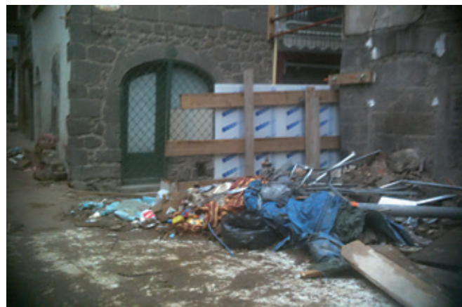
« vraiment super, le décor du centre ville.... »

Voilà qui illustre bien l’incapacité de cette municipalité à monter un dossier qui tienne la route, alors que d’autres (Pézenas,